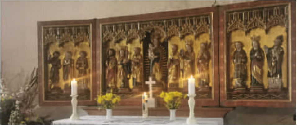
War letztmalig in Hochstedt zu sehen: der Altar

Wie viele Hochstedter wissen oder sich vielleicht sogar noch erinnern, ist die Hochstedter Kirche im Januar 1978 infolge einer Brandstiftung vollständig ausgebrannt. Das Inventar wurde zerstört, auch der gotische Schnitzaltar von 1520, der Taufstein aus dem 16. Jahrhundert und die Kanzel von 1680. Dank vieler Spenden und tatkräftiger Unterstützung wurde die Kirche trotz Widerstand und Schwierigkeiten wieder instandgesetzt. 1981 war bereits der Dachstuhl fertig, und mit dem eigentlichen Ausbau wurde 1982 begonnen, die Einweihung folgte 1984. Einen Altar erhielt die Hochstedter Kirche als Leihgabe aus Nottleben: Aus der dortigen baufälligen Kirche